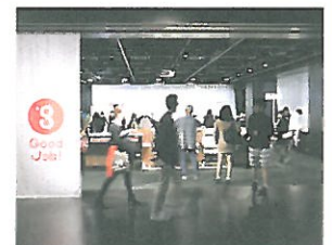
2014 GoodJob! 展

お申し込み方法 | 次の事項を記載のうえ、2015年1月20日(火)までに、一般財団法人たんぼぼの家に Fax または E-mail でお申し込みください。