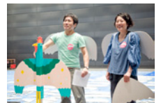
オカダン・グラフィック

※当日は絵の具を使いますので、汚れてもかまわない服装でお越しください。 ※手を拭くタオルなどはご持参ください。 ※11月24日(月・振休)のイベント当日、舞台とあわせて制作風景を紹介するパネルを展示いたします。写真撮影・発表させていただきますことをご了承ください。