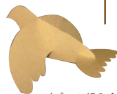
(パーツ組み合わせ例)