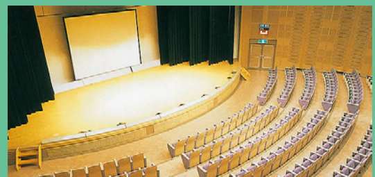
会場のアバンセホール